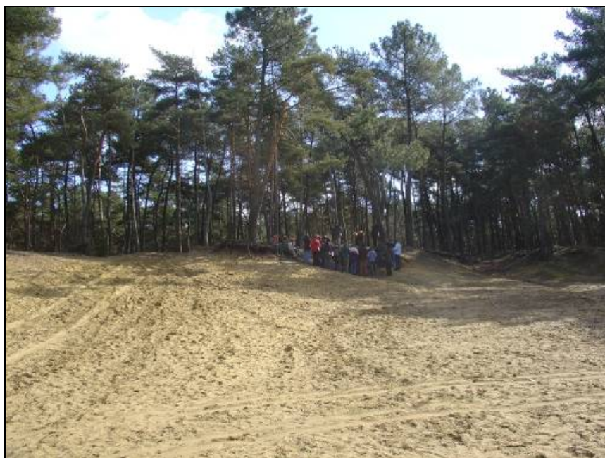
Figuur 1. Stuifduinlandschap te Herentals-Toeristentoren.

Het moedermateriaal in deze site is Holoceen (Boreaal), verstoven zand dat een duincomplex vormt (figuur 1). Binnen dit complex hebben zich zowel Arenosolen als Podzolen ontwikkeld. De Podzolen komen voor op materiaal dat reeds lang gestabiliseerd is (Boreaal) terwijl de Arenosolen in recentere opstuivingen aangetroffen worden.