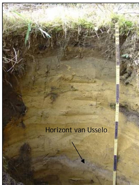
Figuur 3. Horizont van Usselo te Herentals-Toeristentoren.