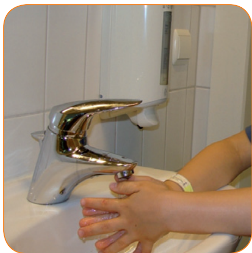
Tussen de vingers afspoelen