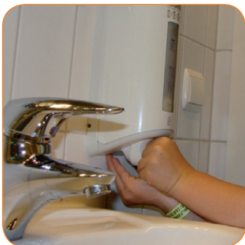
Zeep op de handen doen