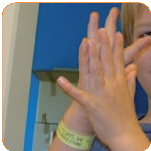
Tussen de vingers wrijven