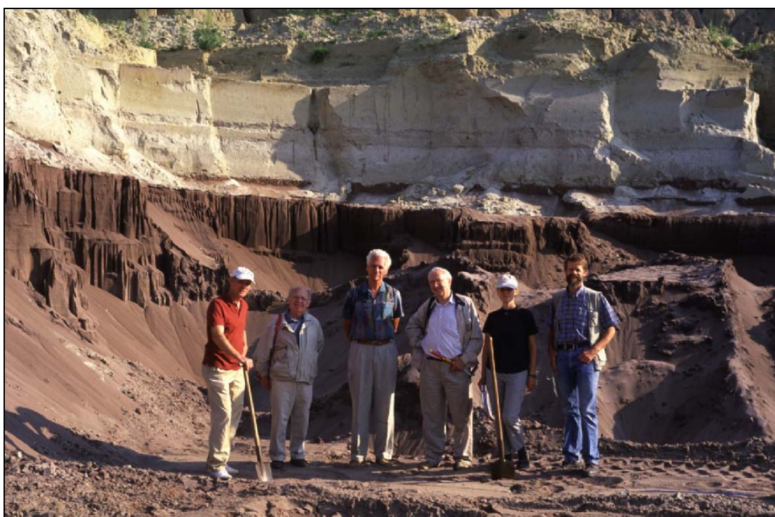
Figuur 1. Algemeen beeld van de "chocoladebruine horizont".

De roelantszandgroeve herbergt een vanuit bodemkundig standpunt zeer merkwaardig fenomeen, namelijk de zogenaamde "chocoladebruine horizont". Deze horizont doet zich voor in de bovenste zone van de Kerkom zanden. Zij is ongeveer 2 a 3 meter dik en bestaat uit zeer donker rood (5YR2/4) zand (figuur 1).