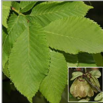
iep / olm