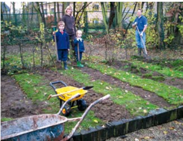
De kleuters en de juffen van GO! De Klaver, Destelbergen, de.klaver@pantarhei.be