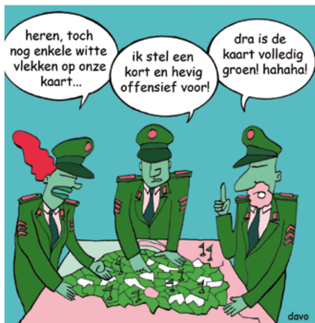
gemeenten zonder mosschool

Misschien kun je als school ook jouw gemeente overtuigen om actiever de scholen te ondersteunen?