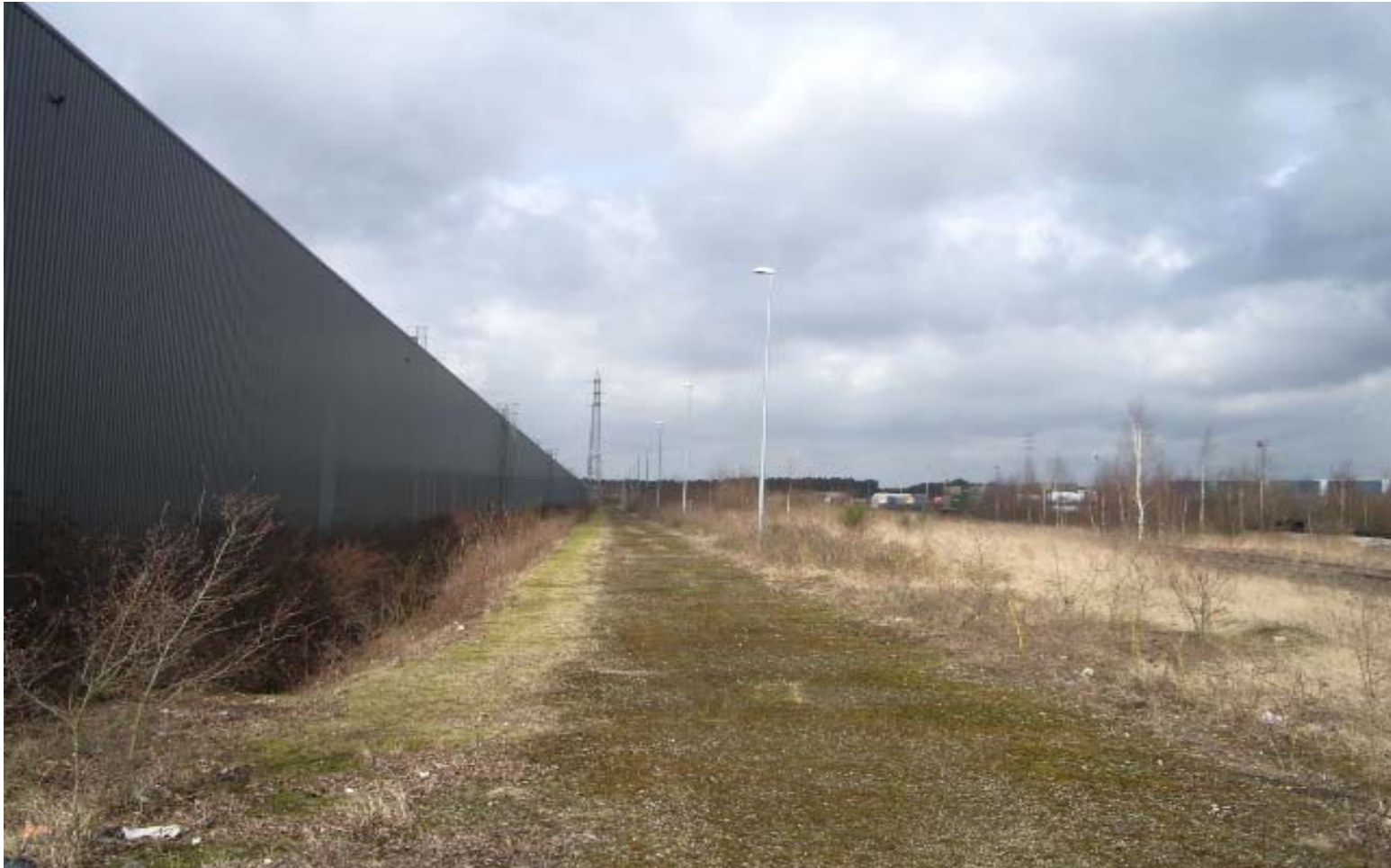
Bedrijven en biodiversiteit een prima combinatie 20-03-2009