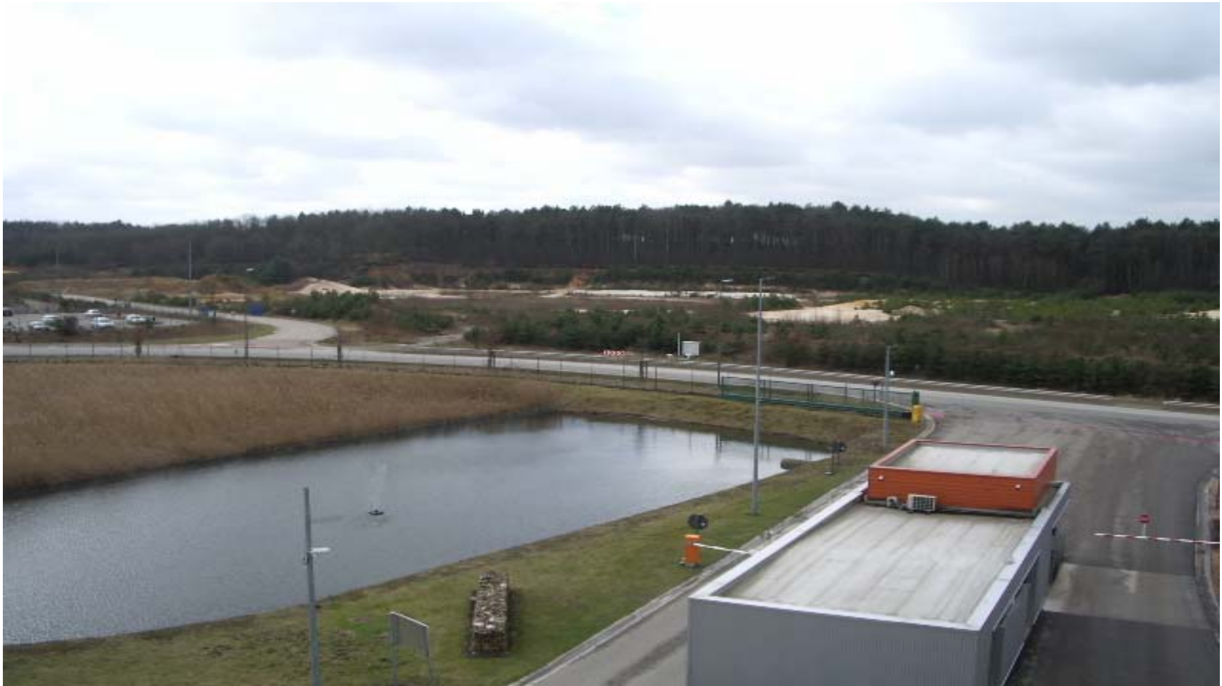
Bedrijven en biodiversiteit een prima combinatie 20-03-2009